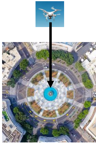
צילום אווירי אנכי

צילום אווירי הוא צילום שמצלום ממטוס או מרחפן. צילום אווירי אנכי הוא צילום המצלום ישר כלפי מטה, כפי שמתואר בתמונה משמאל.