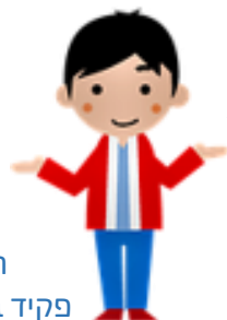
רון פקיד בבנק 2

הבנק שלנו מציע לכם תנאים הרבה יותר טובים! מציע לעבור אלינו!