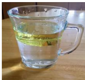
שמן צף על מים

(סרטון) https://www.youtube.com/watch?v=SWS1iYgjynw