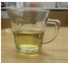
שמן קפוא שוקע בתוך שמן נוזלי

כאשר מקררים חומר בדרך כלל צפיפותו גדלה. למשל, כשמקפאים שמן צפיפותו גדלה. שמן קפוא צפיפותו גדולה יותר מצפיפות שמן נוזלי. ולכן אם נכניס קוביית שמן קפוא לתוך שמן נוזלי, הקובייה תשקע. יוצאי דופן מבחינה זו הם מים. (סרט)