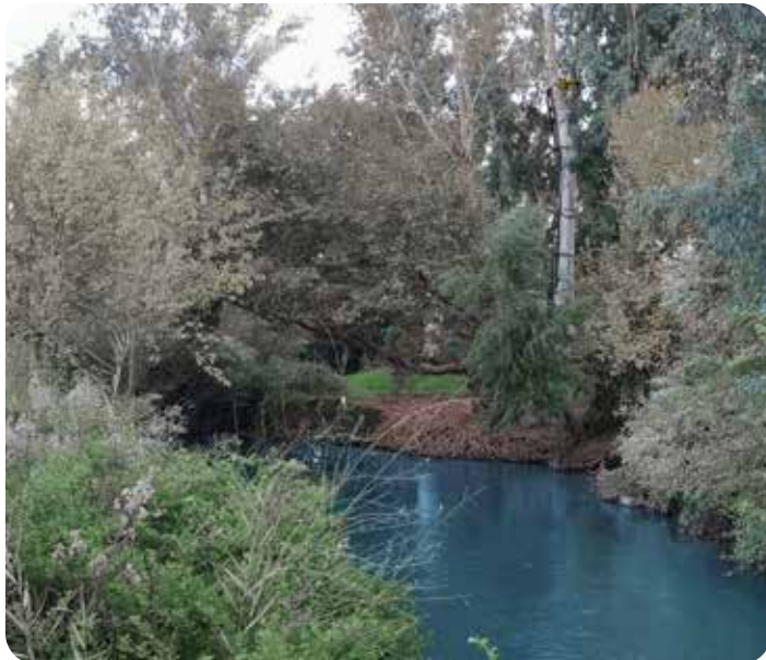
האקליפטוס על האי* *

לפני מספר שנים החליטו מדריכי התנועה לבנות אומגה מעץ האקליפטוס הענק אל הנחל. האומגה מתחילה ממדף שבנו על העץ. כדי להגיע למדף, נבנה סולם ארוך ממתכת. בזמן המחנה, הסולם נשאר מחובר לעץ. עם סיום המחנה, מנתקים את הסולם מן העץ ושומרים אותו במחסן עד הקיץ הבא.